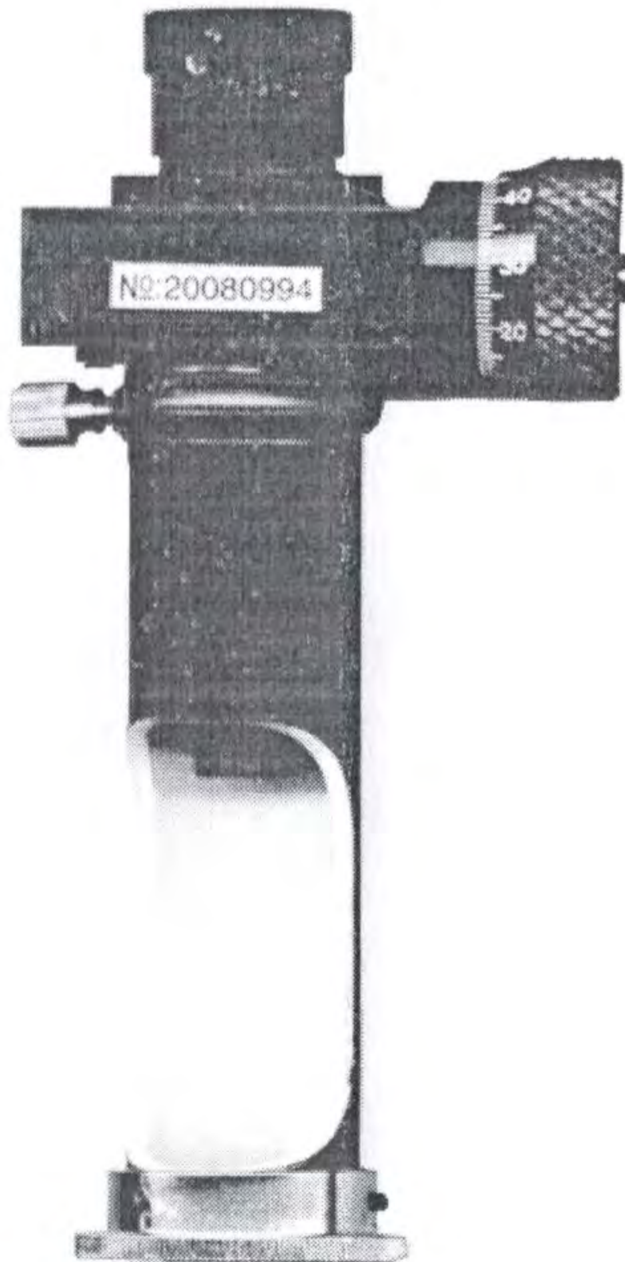
Рисунок А.1 – Микроскоп отсчетный микрометрический МОМ-20