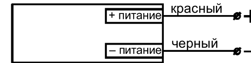
Рис.3. Схема подключения излучателя МикРА Ф4И.