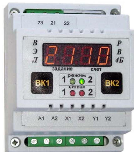
Рис.1 Внешний вид