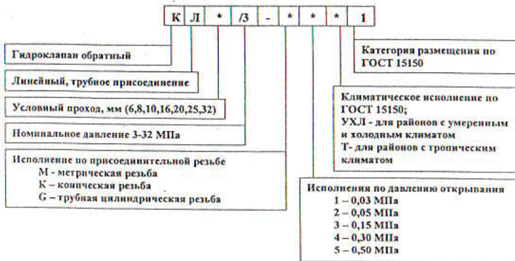
Рисунок 1- структура условного обозначения