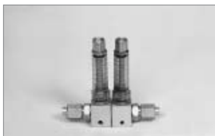
Блок дроссельный смазочный БДИ2