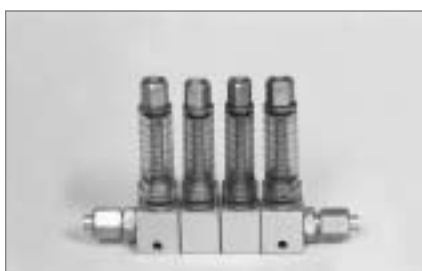
Блок дроссельный смазочный БДИ4