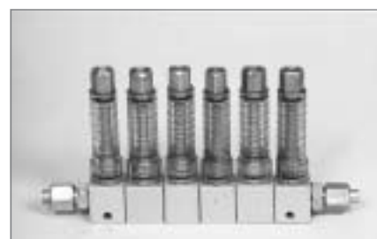
Блок дроссельный смазочный БДИ6